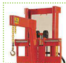
Braccio con gancio